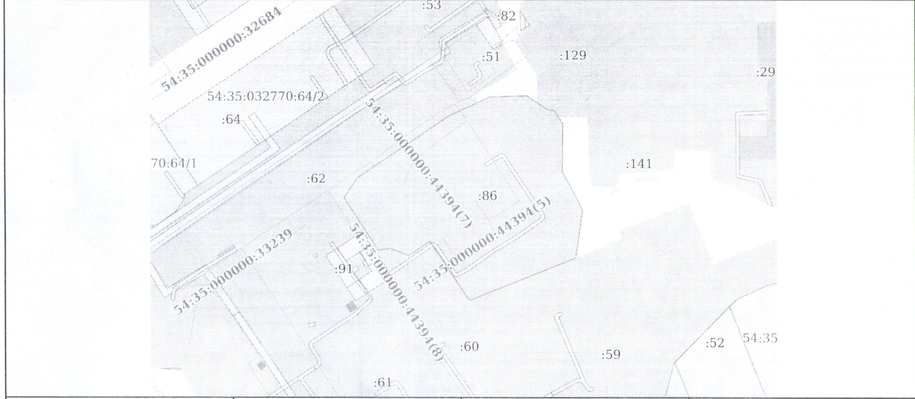
Схема расположения объекта недвижимости (части объекта недвижимости) на земельном участке(ах)

20.02.2023г. Кадастровый номер: 54:35:032770:261